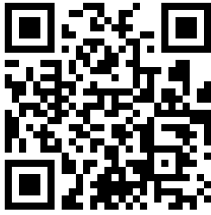
Fernando Bosch JUEZ/A DE CAMARA CÁMARA DE APELACIONES EN LO PPJCyF - SALA II